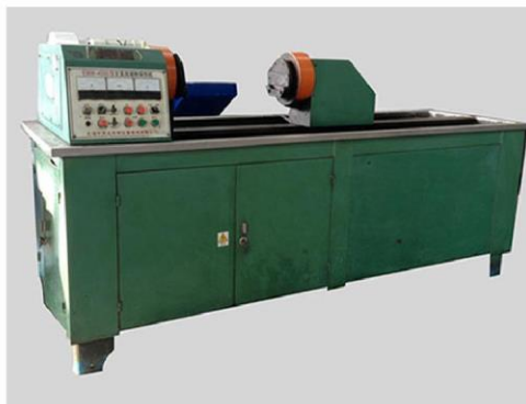
交直流磁粉探伤机